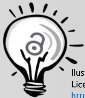
Ilustración "Bombilla abierta", José Luis Rubio Tamayo

Licencia: Creative Commons Reconocimiento 4.0 Intl.