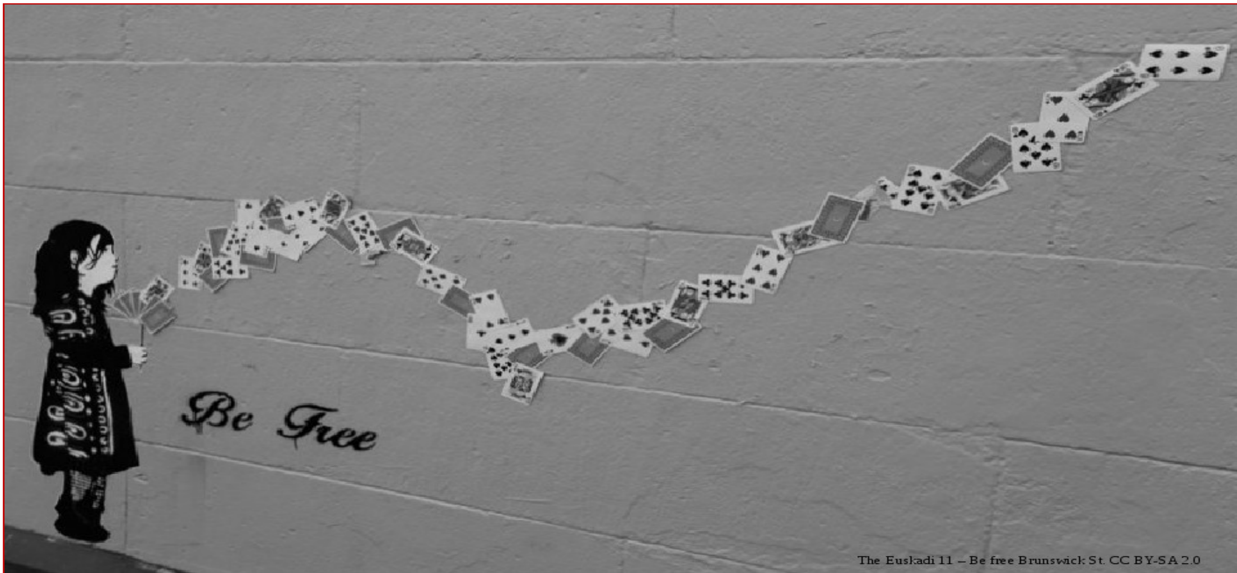
The Euskadi 11 – Be free Brunswick St. CC BY-SA 2.0