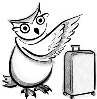
Ilustración: “Búho Libre” original, Sergio Rodríguez Asenjo. Rediseño de Mariam Ben

Esta presentación se distribuye bajo la licencia “Atribución-CompartirIgual 4.0 Internacional” de Creative Commons .